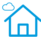
Calidad del aire en el exterior